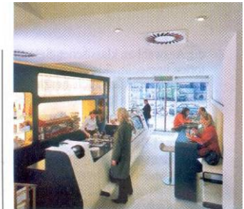
„Kreipe“: Top-Adresse für caffè und Konditorklassiker

Die bekannte hannoversche Konditorfamilie geht mit der Zeit, hat das renommierte Stadtcafé vor einigen Jahren aufgegeben und