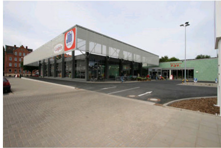
Der Eingang liegt in einem Verbindungsgelenk, dort, wo sich die beiden Baukörper überschneiden.