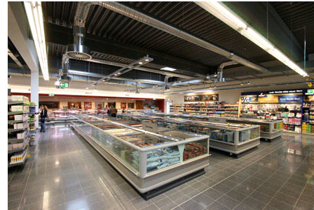
Hohe Räume im Innern, da die Architekten auf abgehängte Decken verzichtet haben.

Das Stützraster der außenliegenden Betonpfeiler des Getränkemarkts wirkt, als würden damit die Bäume der angrenzenden Allee zitiert. Gekrönt wird dieser Teil des Marktes durch eine mehr als vier Meter auskragende Membrankonstruktion. Sie dient als Projektionsfläche von Werbeflächern, schützt vor sommerlicher Überhitzung und verleiht dem Bau Zeichenhaftigkeit. Je nach Witterung, Tages- und Jahreszeit (und) ändert der transluzente Stoff die Wahrnehmung des Gebäudes, wirkt wie von geschlossener Umrandung oder wie eine transparenter Struktur. Der Supermarkt im hannoverschen Stadtteil List muss einen Vergleich mit den bekannten österreichischen Pendanten von MPREIS nicht scheuen. Despang Architekten haben bereits mit ihrem Nahversorger (ausgezeichnet mit dem Niedersächsischen Staatspreis für Architektur 2004) bewiesen, dass auch der alltägliche Lebensmitteleinkauf durchaus Lust statt Last bedeuten kann. Fortsetzung unbedingt erwünscht! Hartmut Möller