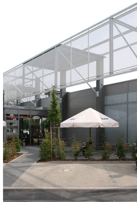
Eine transzente Membran umrahmt den Getränkemarkt.

Lange Zeit kamen Supermärkte lediglich als banale Zweckbauten daher, die bestenfalls in seinen Farben und durch das angebrachte Logo der „Corporate Identity“ des jeweiligen Unternehmens entsprachen. Seit in jüngster Vergangenheit verschiedene Beispiele im Ausland auf sich aufmerksam machten und mit Preisen überhäuft wurden, rücken Bauherren auch hierzulande von belangloser 08/15-Architektur ab. In wirtschaftlich schwierigen Zeiten möchte der Handel Kunden durch ein unverkennbares Zeichen und ein angenehmes Raumerlebnis binden oder gewinnen. Schließlich vermögen attraktiv gestaltete Häuser als Aushängeschild einen deutlich größeren Einfluss auf die Käufer zu haben, als sämtliche Zeitungsbeilagen und Fernsehspots zusammen.